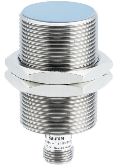
图片与实际产品相似