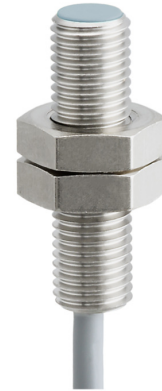
图片与实际产品相似